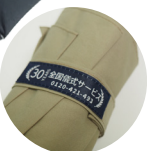
全国儀式サービス 30周年のタグ付き